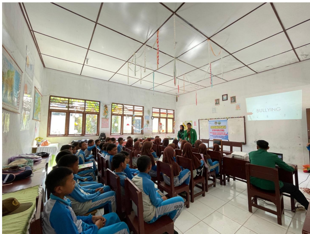
Gambar 1. Kegiatan Interaksi aktif kepada para siswa di ruang kelas SMP Negeri Sosopan

Pengetahuan tentang bullying : Pada pretest , hanya 70% siswa yang menjawab pertanyaan tentang definisi bullying dengan benar. Setelah mengikuti sosialisasi, persentase siswa yang menjawab pertanyaan tersebut dengan benar meningkat menjadi 80%