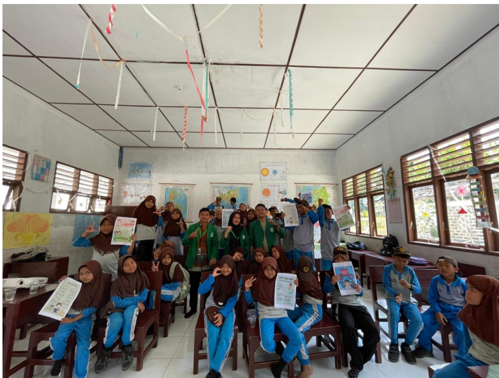
Gambar 4. Kegiatan Setelah dilakukan Sosialisasi Di SD Negeri 0310 Simaninggir